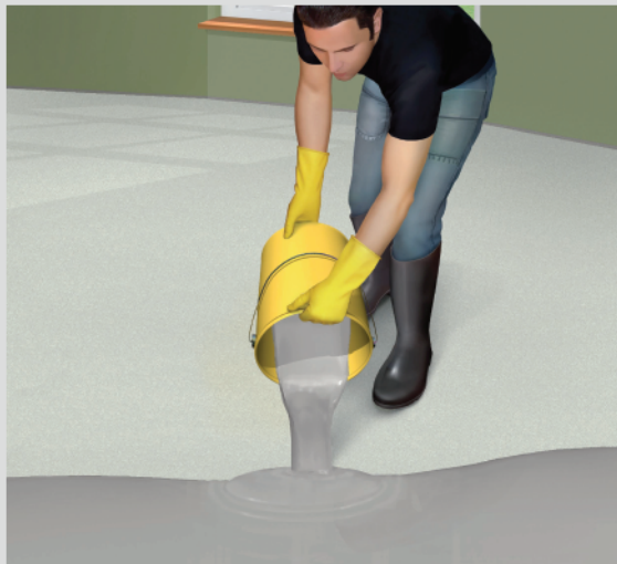
把已混和的砂漿傾倒於地面