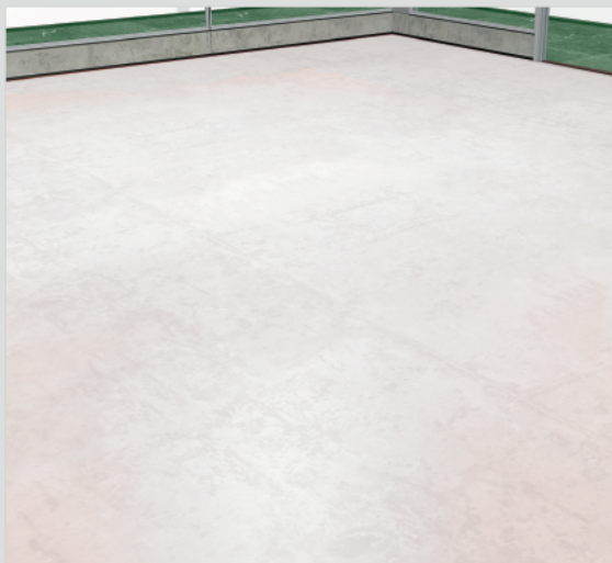
乾透後可開放予行人使用

*施工前需在施工面塗上“Sikalastic®-500 Acrylic Primer AP”底油。